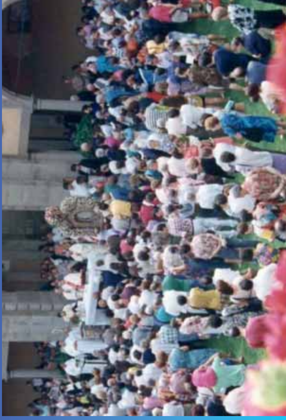
Santa Messa all’aperto nella festa di Maria Assunta in Cielo (Santa Maria)