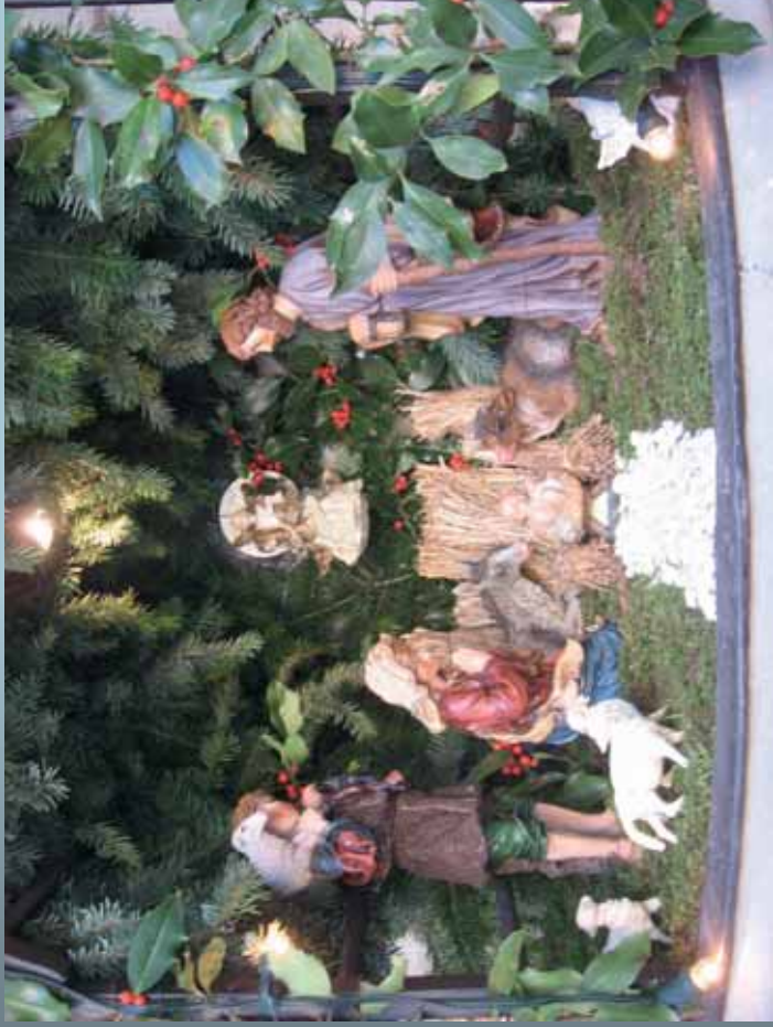
Una rappresentazione del presepio al Santuario di Boccadirio

“Mentre si trovavano in quel luogo (Betlemme), si compirono per lei (Maria) i giorni del parto, diede alla luce il suo figlio primogenito, lo avvolse in fasce e lo depose in una mangiatoia” (Lc 2,6-7).