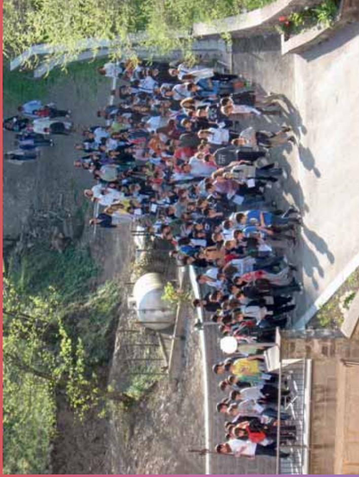
Giovani studenti in pellegrinaggio orante verso il Santuario

Maria ci ricorda che la nostra vita sulla terra è tutta un pellegrinaggio, perché “non abbiamo qui una dimora fissa, ma tendiamo a quella futura” (Eb 13,14), e che “la nostra patria è il cielo” (Fil 3,20).