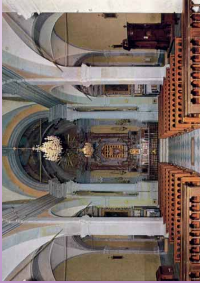
Foto storica dell'interno del Santuario