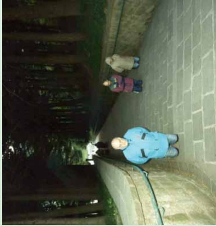
In ginocchio lungo la salita al Santuario.

“ ... promettendo che tutti coloro che fossero poi devoti e frequentatori di questo luogo otterrebbero tutto ciò che, sotto protezione e invocazione di Lei, domandassero al Sommo Dio.”