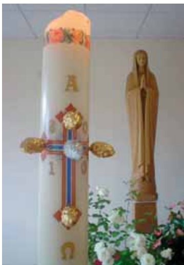
Accanto al cero pasquale, simbolo di Gesù risorto, c'è Maria, modello della nostra fede.

Tutte le altre feste del Signore, e anche le varie memorie della Madonna e dei Santi, partono da qui e domandano di portare qui. E così anche tutti gli altri Sacramenti, le pie pratiche approvate dalla Chiesa, come tutta la preghiera e la vita della Chiesa e di ogni cristiano, perché la Pasqua del Signore è il fondamento di tutto quello che crediamo, siamo e viviamo come cristiani.