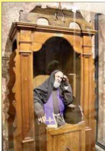
Il Santo Padre Pio in confessionale

Una Comunità che Lui stesso ha definito il suo Corpo, in modo da essere servito o of-