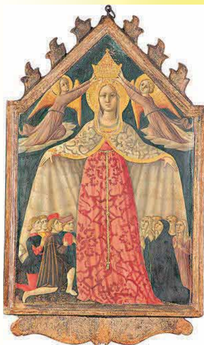
Madonna della Misericordia Seconda metà del 500

Ma lo farai regolarmente e sempre con amore, nel luogo e con il Sacerdote possibili, “magnificando” con Maria la misericordia del Signore, anche con la bocca, ma soprattutto con il cuore e con la vita.