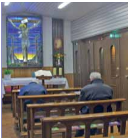
Santuario: Cappella delle Confessioni

Rispetto la natura, ammiro le sue meraviglie e lodo il suo Creatore?